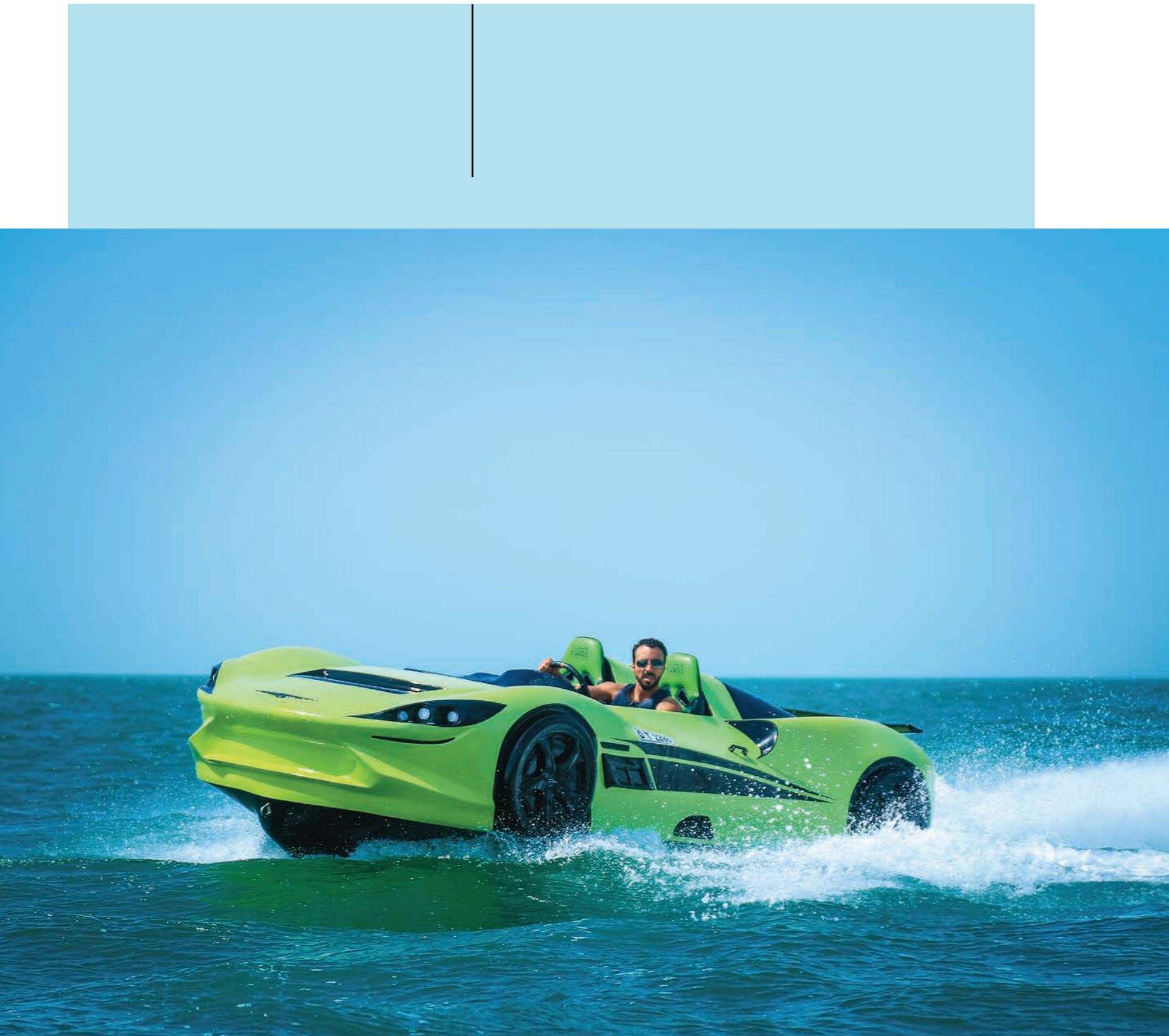
ФОТО И ВИДЕО